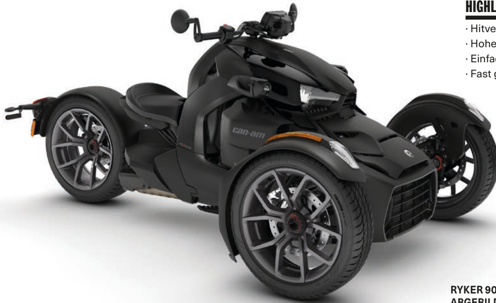
RYKER 900 ABGEBILDET MIT VERKLEIDUNGEN IN INTENSE BLACK